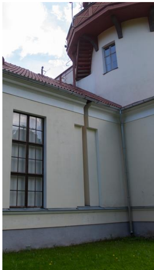
o Vaated seest